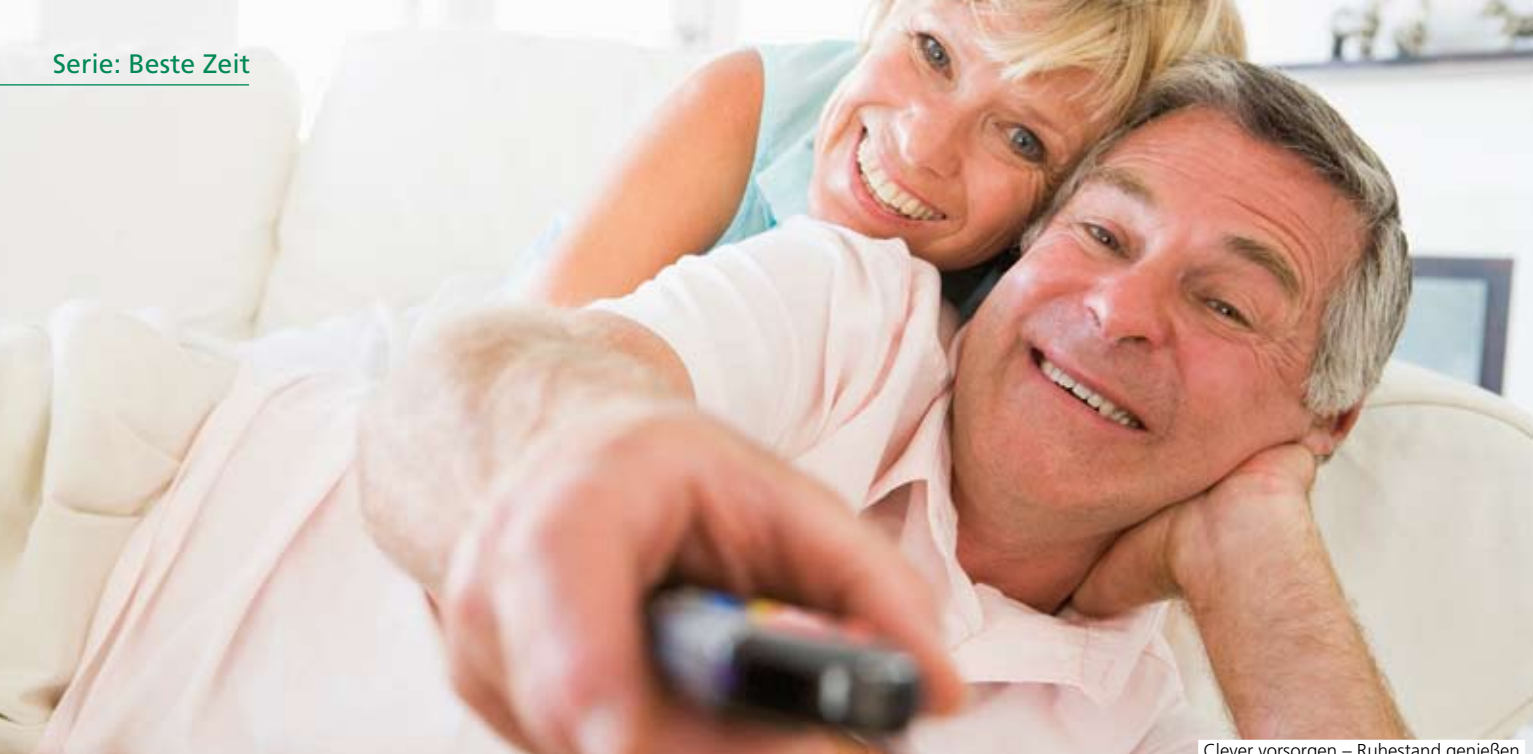
Clever vorsorgen – Ruhestand genießen