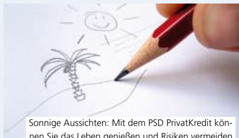
Sonnige Aussichten: Mit dem PSD PrivatKredit können Sie das Leben genießen und Risiken vermeiden

Viele Träume im Leben haben einen Haken: Sie sich zu erfüllen, kostet Geld. Der PSD PrivatKredit gibt Ihnen dafür Spielraum – bei maximaler Sicherheit