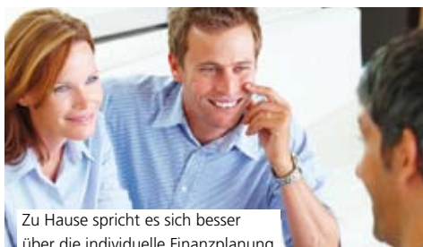
Zu Hause spricht es sich besser über die individuelle Finanzplanung

Es gibt viele ganz praktische Gründe, unseren mobilen Service zu nutzen. Etwa wenn die eigene Mobilität eingeschränkt ist, man bei den