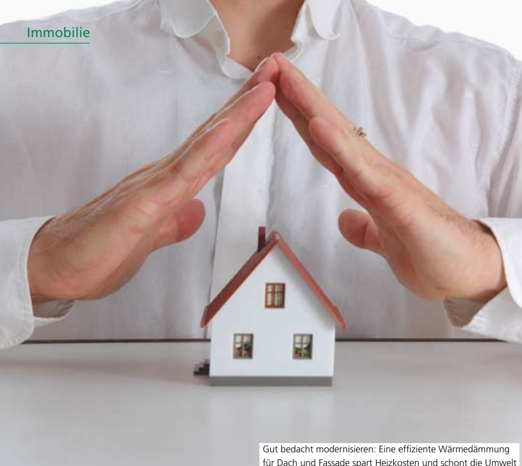
Gut bedacht modernisieren: Eine effiziente Wärmedämmung für Dach und Fassade spart Heizkosten und schützt die Umwelt