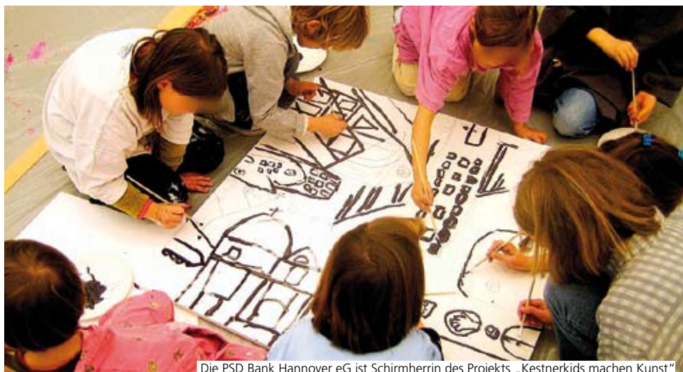
Die PSD Bank Hannover eG ist Schirmherrin des Projekts „Kestnerkids machen Kunst“

Mit dieser uns sehr sympathischen Philosophie wurde die Kestnergesellschaft zu einem der erfolgreichsten und bekanntesten Kunstvereine in Deutschland. Und so fiel die Entscheidung nicht schwer, an wen sich unsere Kulturförderung richten soll.