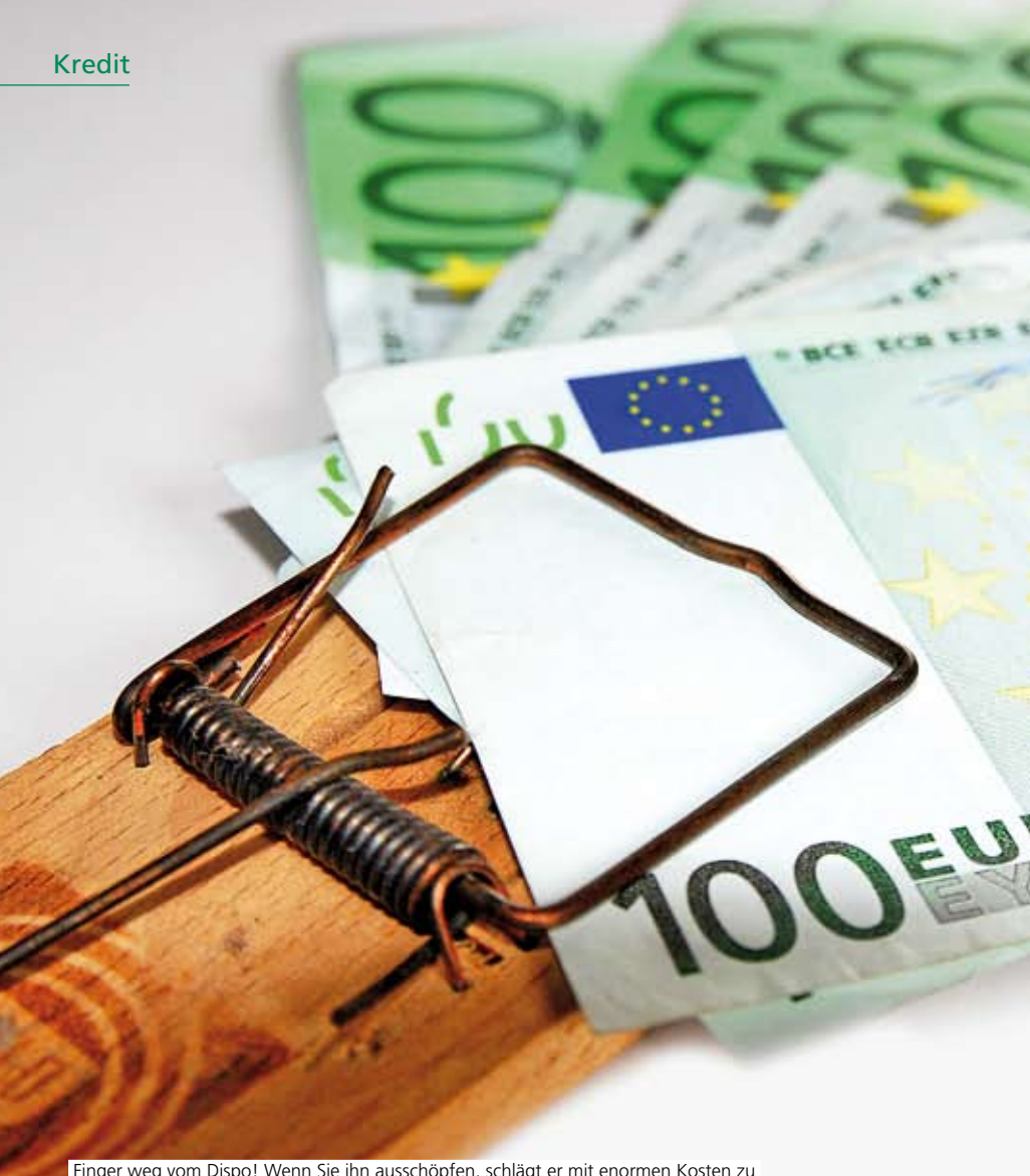
Finger weg vom Dispo! Wenn Sie ihn ausschöpfen, schlägt er mit enormen Kosten zu