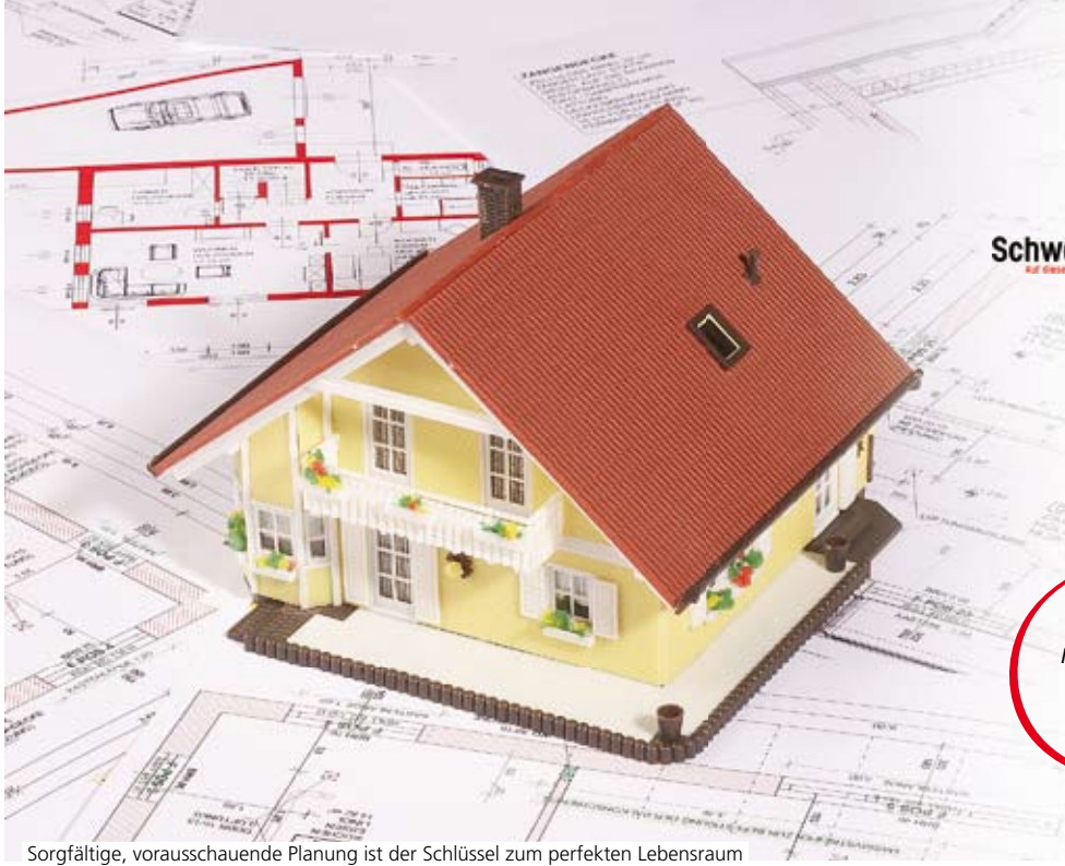
Sorgfältige, vorausschauende Planung ist der Schlüssel zum perfekten Lebensraum

Schwäbisch Hall Auf diese Weise können Sie bauen