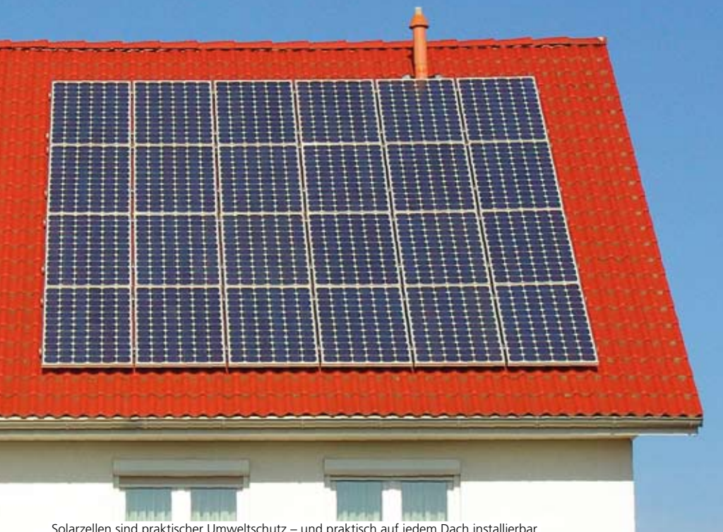
Solarzellen sind praktischer Umweltschutz – und praktisch auf jedem Dach installierbar