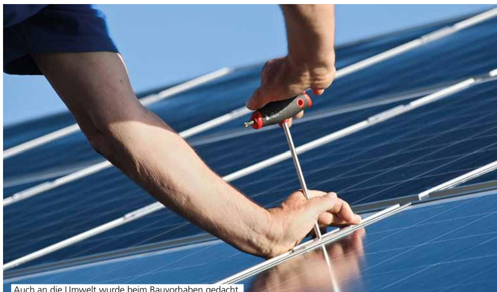
Auch an die Umwelt wurde beim Bauvorhaben gedacht.

empfiehlt dafür den PSD ImmoKredit mit Pfiff: „Dieses spezielle Darlehen für Eigentümer bietet einen Spielraum zwischen 10.000 und 30.000 Euro – genug, um z. B. das Dach auszubauen, ein schickes Wellnessbad einzurichten oder die alte Heizung gegen ein sparsames, umweltfreundliches System auszutauschen.“ Und die Vorteile gegenüber normalen Immobilienkrediten? „Erstens überzeugt der PSD ImmoKredit mit Pfiff natürlich mit günstigen Zinssätzen sowie verschiedenen Laufzeit- und Tilgungsoptionen“, berichtet Martin Mengeling. „Aber ganz wichtig: Weder Grundschuldeintrag noch Besichtigungstermin sind notwendig. Selbst die Ablösung eines teureren Immobilienkredits ist damit möglich. Und das alles bei schneller, unbürokratischer Abwicklung.“