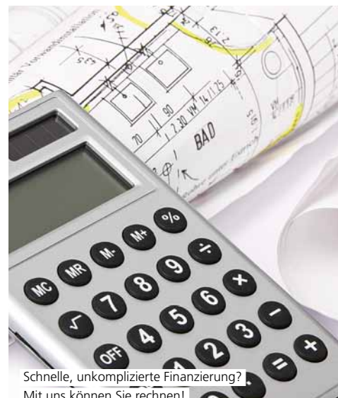
Schnelle, unkomplizierte Finanzierung? Mit uns können Sie rechnen!