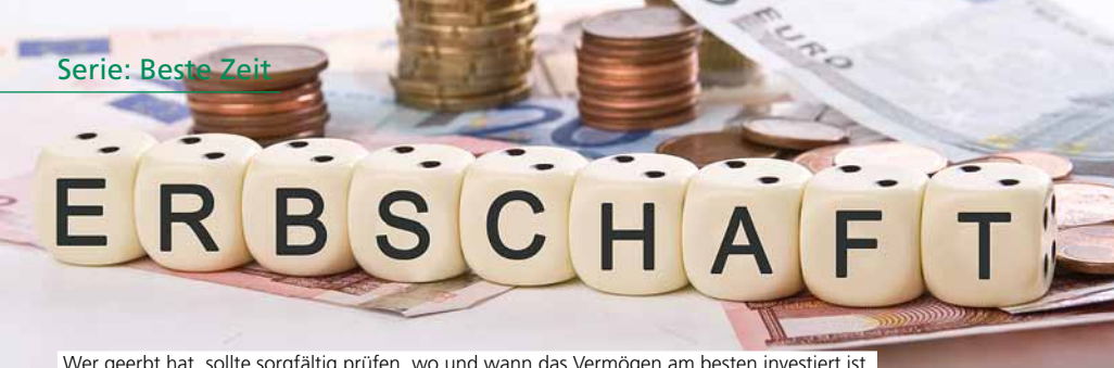
Wer geerbt hat, sollte sorgfältig prüfen, wo und wann das Vermögen am besten investiert ist.