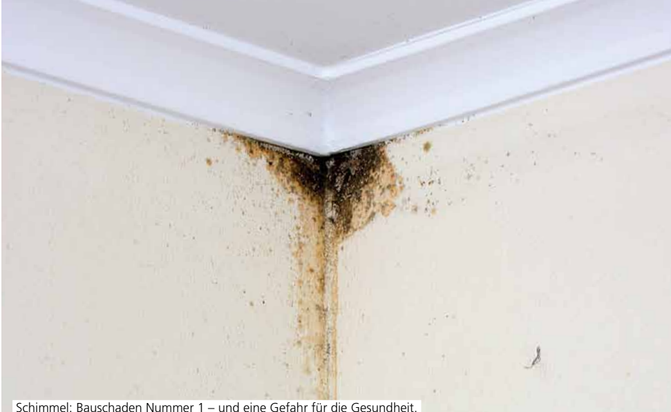
Schimmel: Bauschaden Nummer 1 – und eine Gefahr für die Gesundheit.